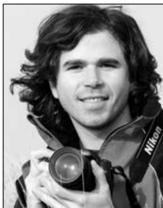
Text și foto: Arthur Mustafa

Surprinzătoare și diversă, natura nu lasă niciodată fotograful la ananghie. Dar nu-i bătătoarește calea și nici nu-l trage de mânecă. Tronează și așteaptă cuminte să fie descoperită. Arthur Mustafa a știut și unde să caute. S-a dus în Ceahlău să deschidă baierile cerului. Ce comori a găsit și cum s-a raportat la ele, puteți vedea în reportajul care urmează. (F.Ș.)